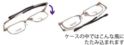
ケースの中ではこんな風にたたみ込まれます

カンダオプティカル設計・開発による回転丁番 (スプリング内臓) でジャストポケットサイズの眼鏡が実現しました。